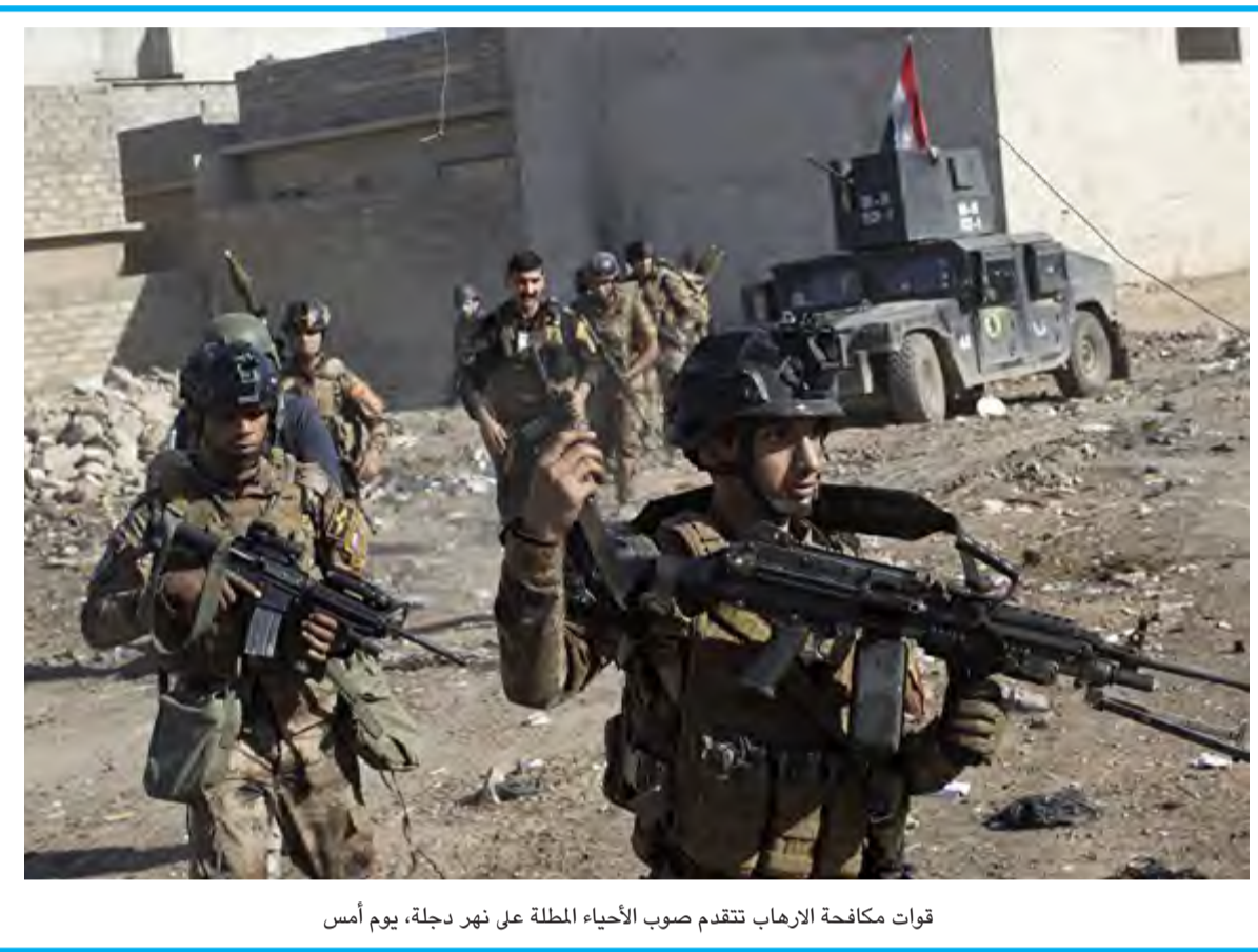
قوات مكافحة الإرهاب تتقدم صوب الأحياء المطلة على نهر دجلة، يوم أمس